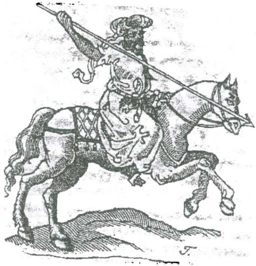
رسم رقم (٣) فارس مملوكي ممسكاً برمح بيده اليمنى

وبالنسبة للعشرة آلاف الباقين من العشرين ألفاً الذين تحدثنا عنهم فيما مضى، فهم من المماليك المرتفعة. يقيمون في المدينة ويأتون يومياً إلى البلاط السلطاني سيراً على الأقدام أو يمتطون فرساً، وينقسمون إلى مجموعات وتتكون كل مجموعة من خمسين أو مائة مملوك، يترأسهم قادة وأمراء، أي هناك أمير مائة أو أمير خمسين. وهم دائماً على أهبة الاستعداد للقتال تنفيذاً لأوامر السلطان أو من ينوب عنه.